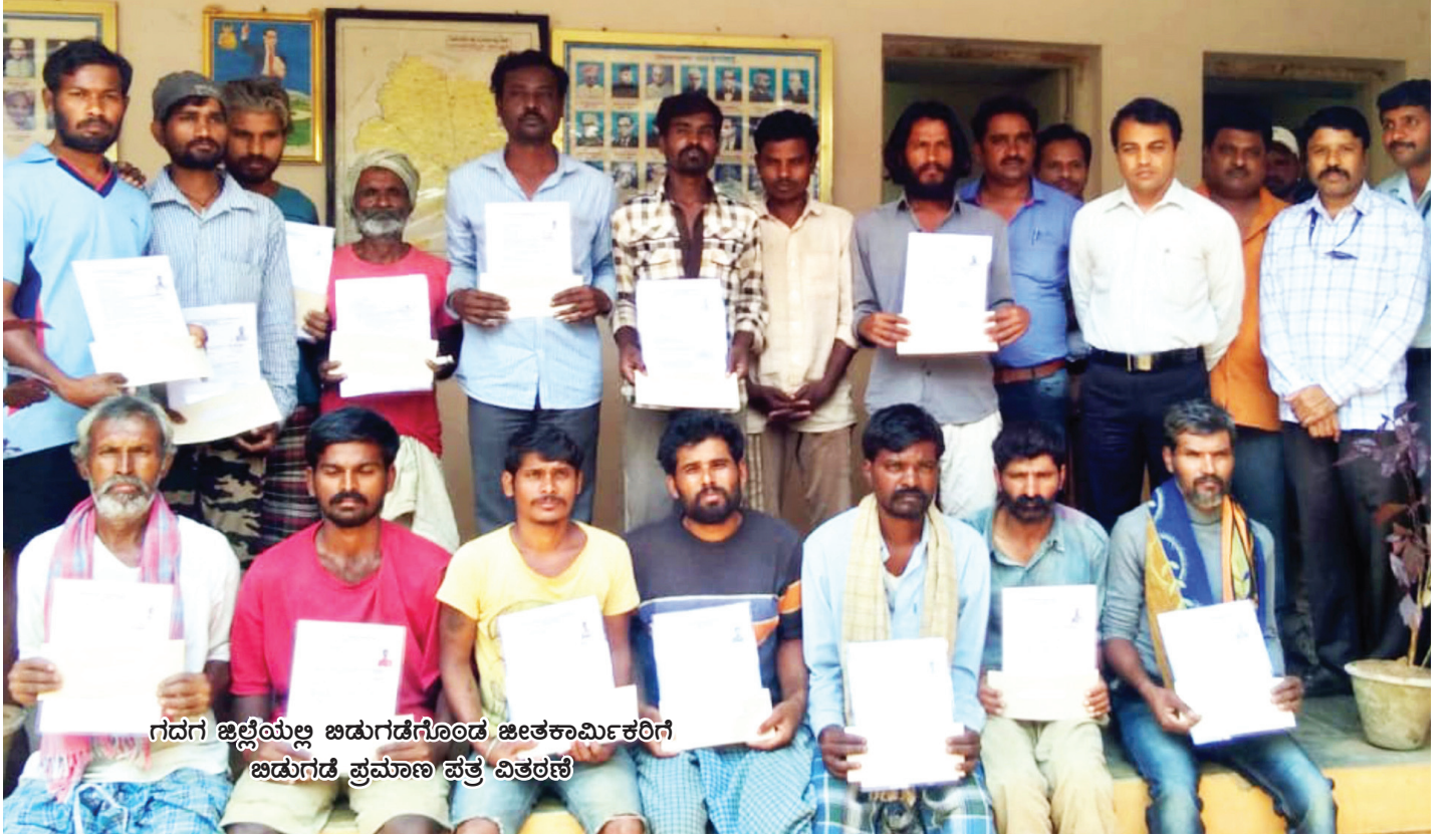
ಗದಗ ಜಿಲ್ಲೆಯಲ್ಲಿ ಬಡುಗಡೆಗೊಂಡ ಜೀತಕಾರ್ಮಿಕರಿಗೆ ಬಡುಗಡೆ ಪ್ರಮಾಣ ಪತ್ರ ವಿತರಣೆ

ಜೀತದಾಳುಗಳ - ಗುರುತಿಸುವಿಕೆ, ಬಡುಗಡೆ, ಪುನರ್ವಸತಿಗೆ ಸಂಬಂಧಿಸಿದಂತೆ ರಾಜ್ಯ ಸರ್ಕಾರದ ಮಾದರಿ ಕಾರ್ಯವಿಧಾನಗಳು ಮತ್ತು ಜೀತ ಪದ್ಧತಿ (ರದ್ದತಿ) ಕಾಯ್ದೆ, 1976 ಕಲಂ 21ರಡಿ ಸಂಕ್ಷಿಪ್ತ ವಿಚಾರಣೆ ಕುರಿತು ವಹಿಸಬೇಕಾಗಿರುವ ಕ್ರಮ