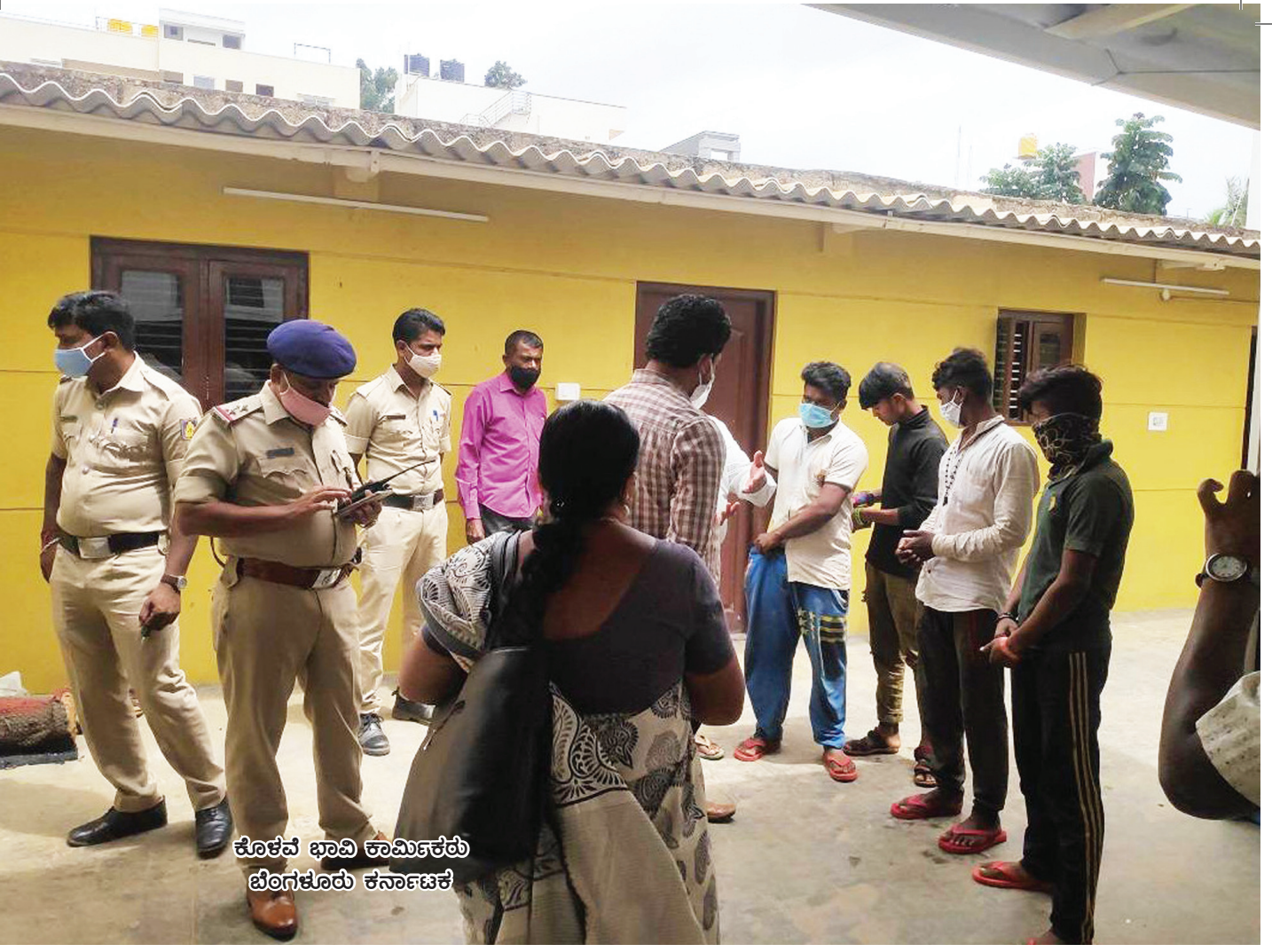
ಕೊಳವೆ ಭಾವಿ ಕಾಮಿಷನರೇಟು ಬೆಂಗಳೂರು ಕರ್ನಾಟಕ